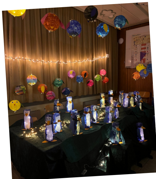
Eulen (1a) und Pinguine (1b)